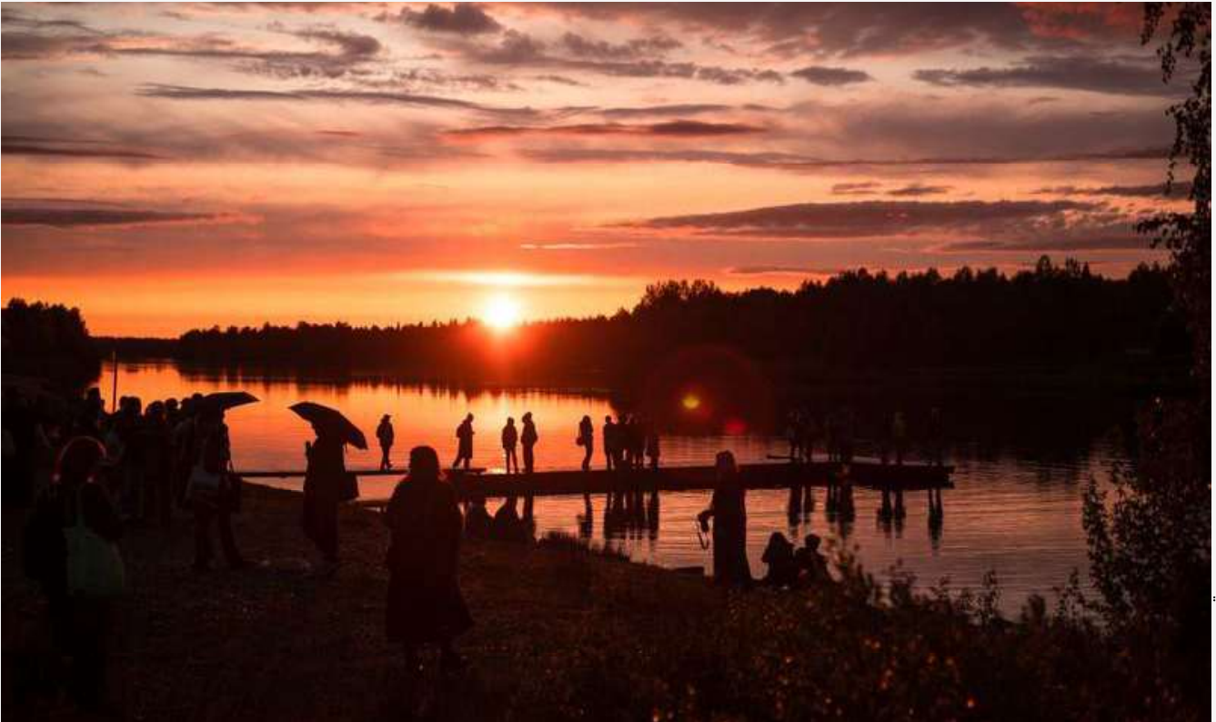
SODANKYLÄN ELOKUVAJUHLAT