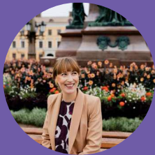
EVELIINA HEINÄLUOMA PUHEENJOHTAJA KANSANEDUSTAJA