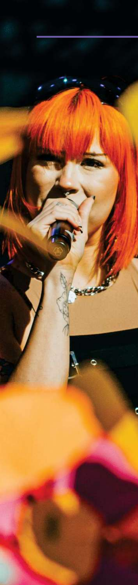
JYVÄSKYLÄN KESÄ - PUISTOJUHLAT

Finland Festivals on Nordic Baltic Festival Platformin, European Festivals Associationin (EFA) ja International Society for the Performing Artsin (ISPA) jäsen. FF:n toiminnanjohtaja oli ISPA:n hallituksen jäsen (Board of Directors) ja lisäksi ohjelmatoimikunnan (Program Committee) jäsen 1.2.2025 asti. Näiden jäsenyyksien kautta FF osallistui seuraaviin tapaamisiin: