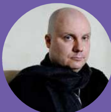
JOHAN TALLGREN MUSIIKIN AIKA