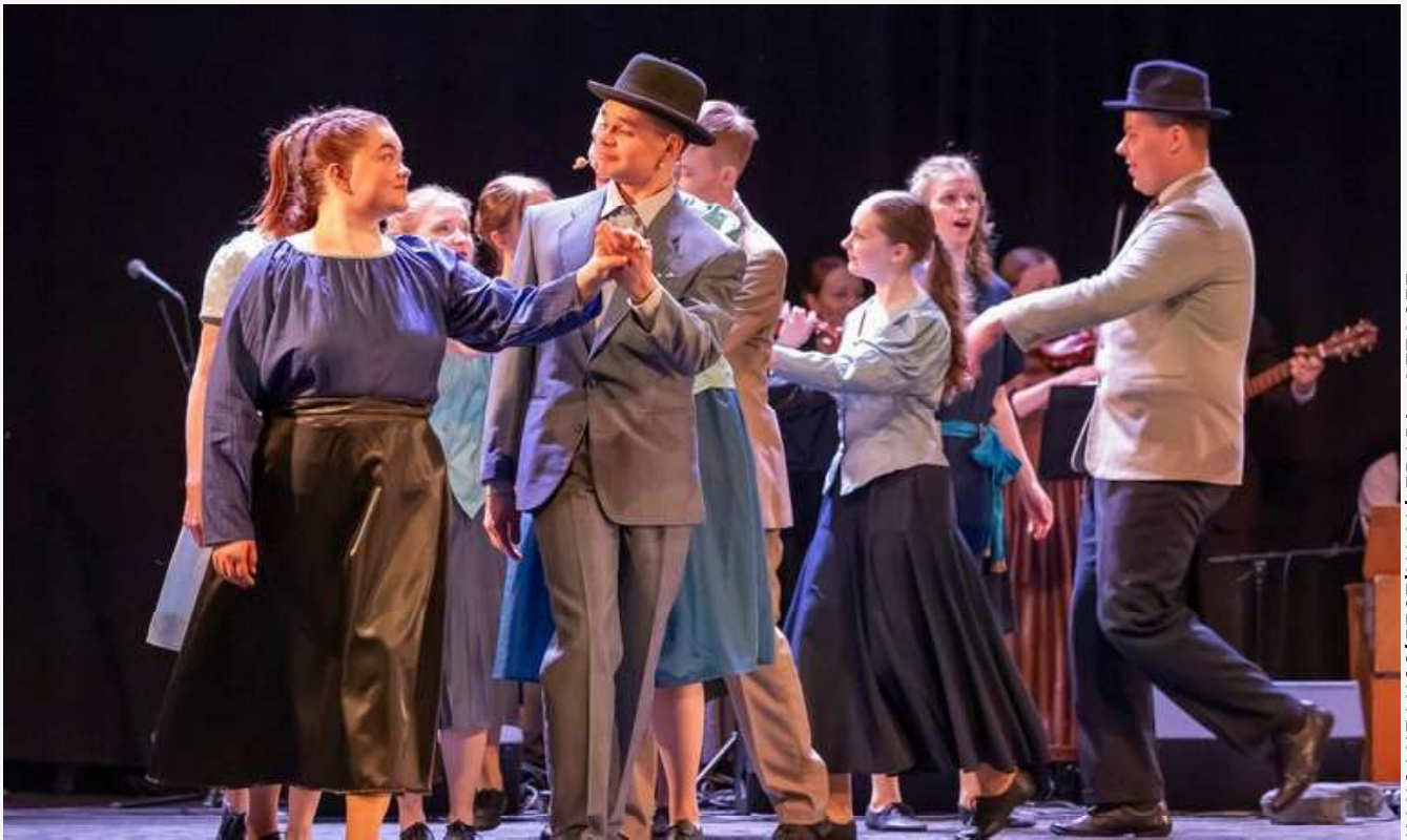
KANSANTANSSIFESTIVAALI TRADI - OTTOSET