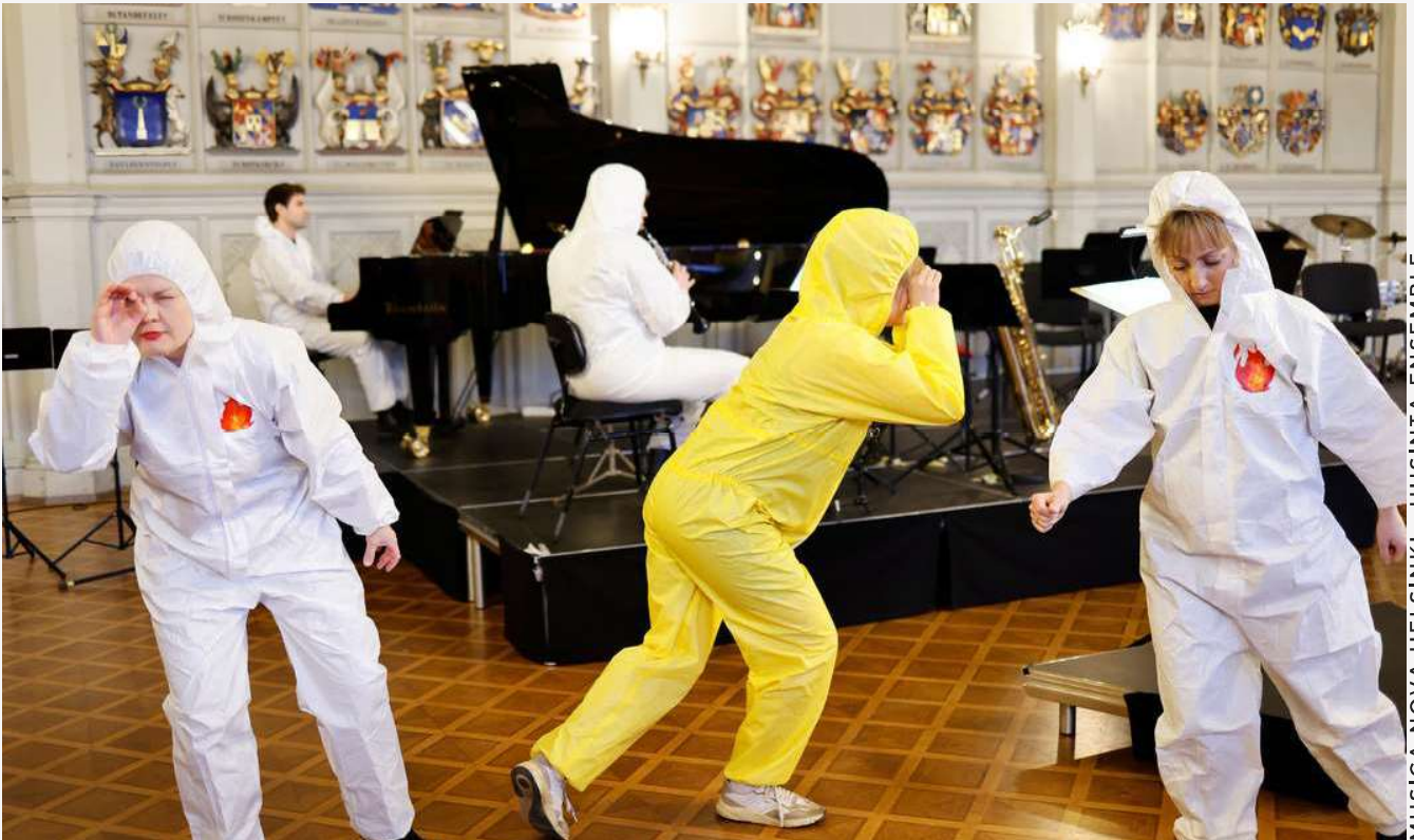
MUSICA NOVA HELSINKI - UUSINTA ENSEMBLE