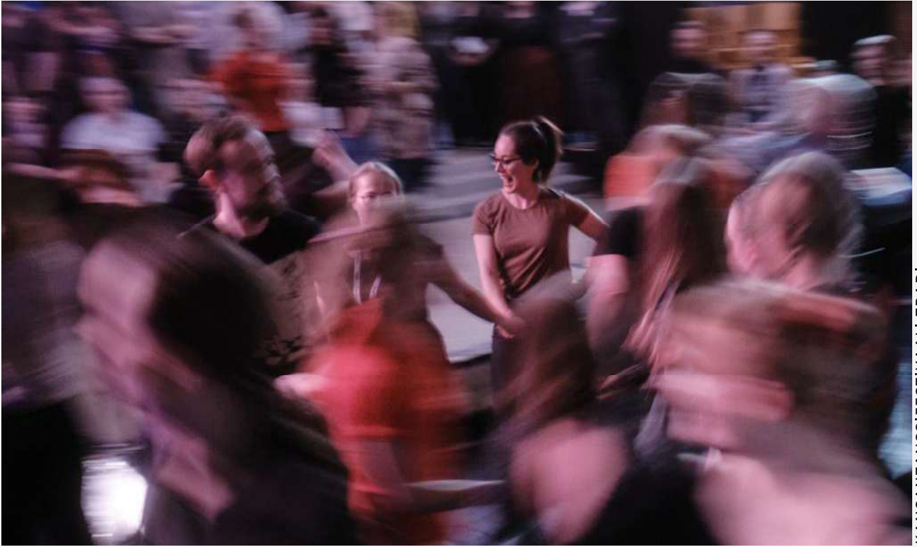
KANSANTANSSIFESTIVAALI TRADI PHOTO VILLE KURKI