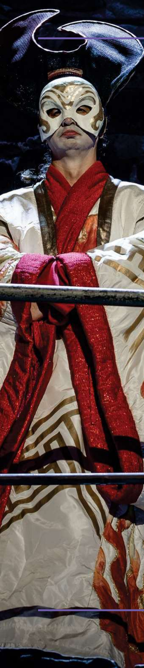
SAVONLINNAN OOPPERAJUHLAT - OOPPERA TURANDOT