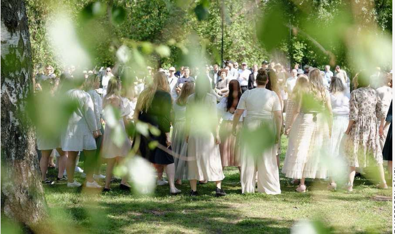
TAMPEREEN SÄVEL

Sisäistä tiedotusta hoidettiin noin kerran kuussa ilmestyvän jäsentiedotteen kautta. Se lähetettiin kaikille jäsenfestivaaleille kymmenen kertaa vuoden 2025 aikana. Lisäksi lähetettiin erikseen festivaalien johtajille ajankohtaisia tiedotteita aina tarpeen mukaan. Finland Festivalin oma WhatsApp-ryhmä oli vilkkaassa käytössä, ja ryhmän noin 70 jäsentä auttoi toisiaan monenlaisissa festivaalien tuottamista koskevissa kysymyksissä.