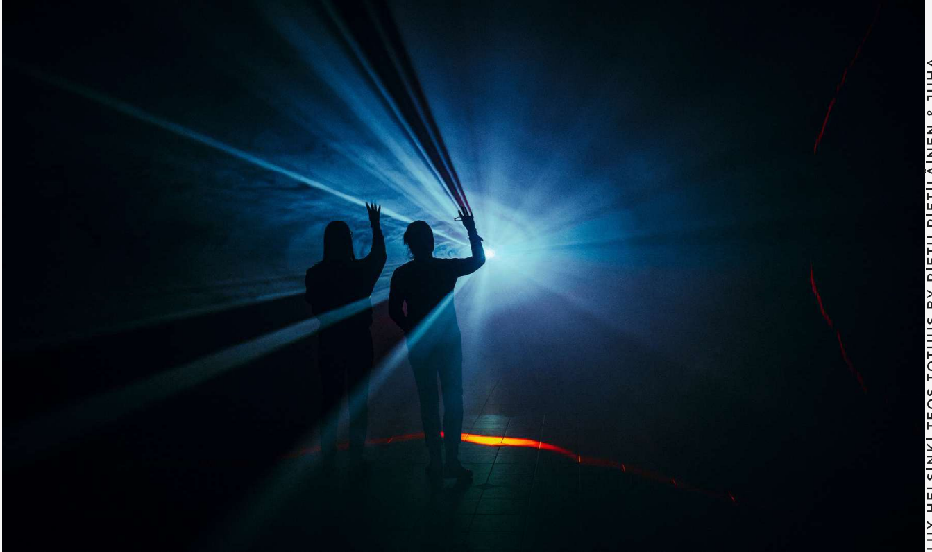
LUX HELSINKI TEOS TOTUUS BY PIETU PIETILAINEN & JUHA VALKEAPÄÄ

Finland Festivalsin strategian ydinkohdat ovat: