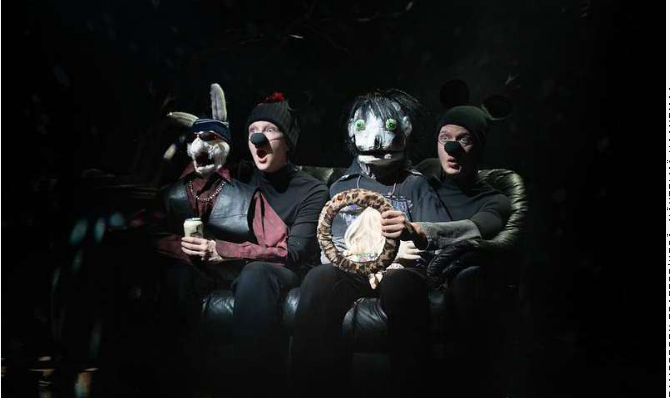
TAMPEREEN TEATTERIKESÄ -NÄYTELMÄ HAAVEMAA - SAVOLAINEN MAYHEM

Virallisia jäseniä oli yhteensä 77 ja festivaalinimikkeitä 89. Jäsenfestivaalit on luokiteltu taidealakohtaisiin kategorioihin, ja uutena kategoriana on vanha musiikki.