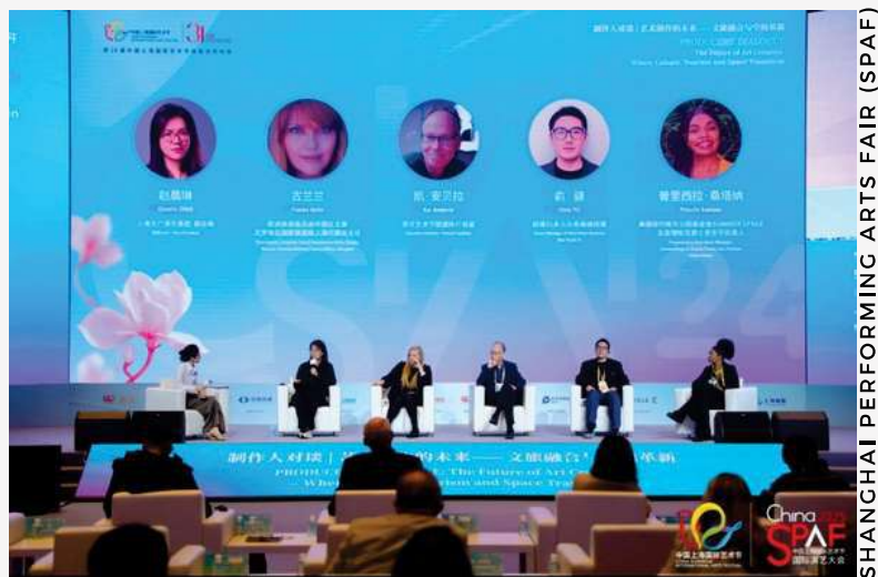
SHANGHAI PERFORMING ARTS FAIR (SPAF)