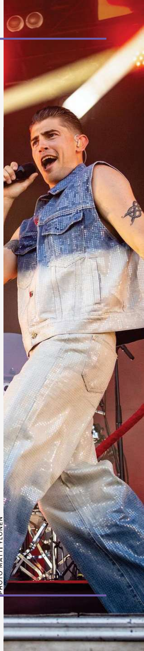
TYÖVÄEN MUSIIKKIJUHLAT - ROBIN

FF:n johdolla käynnistettiin mittava lobbauskampanja erityisesti kansanedustajien ja kulttuuriministerin suuntaan, ja suurin osa festivaaleista saatiin mobilisoitua mukaan. Tuloksena hallitus palasi entiselle linjalleen eli lupasi olla leikkaamatta festivaalituista vuonna 2026. Tämä oli FF:n tärkein edunvalvonnallinen voitto vuonna 2025.