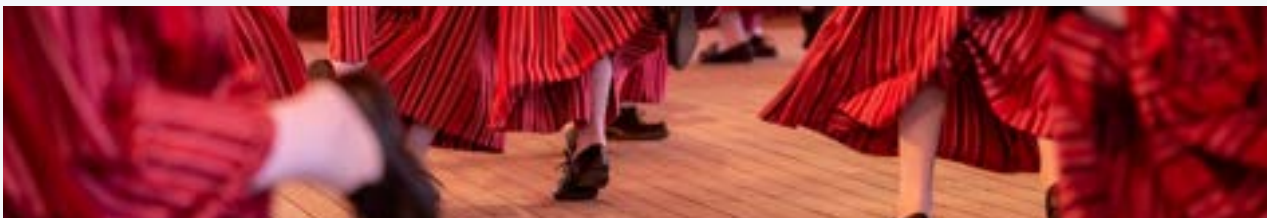
Kaustinen Folk Music Festival