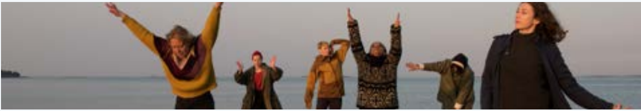
Täydenkuun Tanssit -festivaali