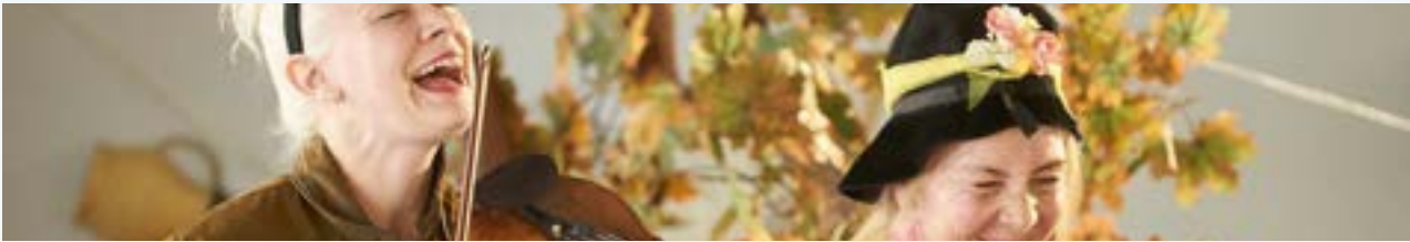
Helsinki Chamber Music Festival