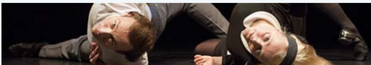
Tanssivirtaa Tampereella –nykytanssifestivaali

Elinkeinopoliittisessa edunvalvonnassa tehtiin edelleen yhteistyötä Matkailu- ja Ravintolapalvelut MaRa ry:n kanssa. FF:n toiminnanjohtaja oli MaRan perustaman festivaalityöryhmän jäsen. Ryhmä piti vuoden 2022 aikana kaksi kokousta. Tapahtumateollisuus ry:n kanssa oltiin säännöllisessä dialogissa.