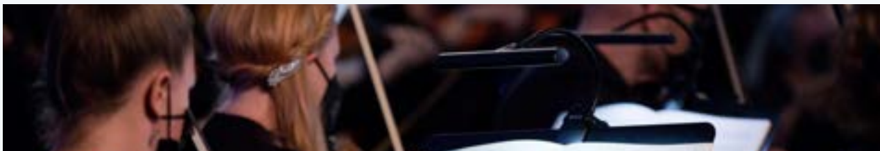
Loviisan Sibeliuspäivät