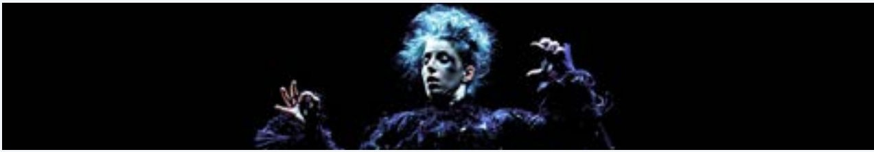
Riihimäen Kesäkonsertit