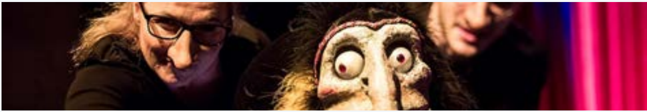
MUKAMAS – Kansainvälinen Nukketeatterifestivaali