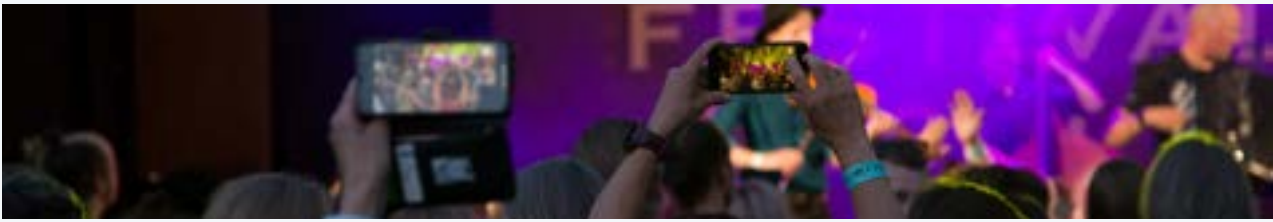
Haapavesi Folk Music Festival