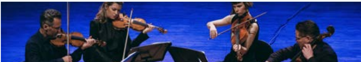
Kauniaisten musiikkijuhlat