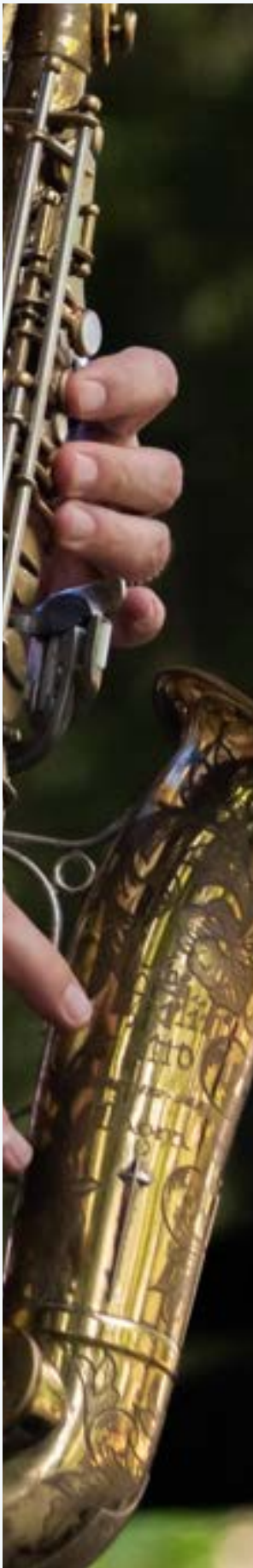
Baltic Jazz