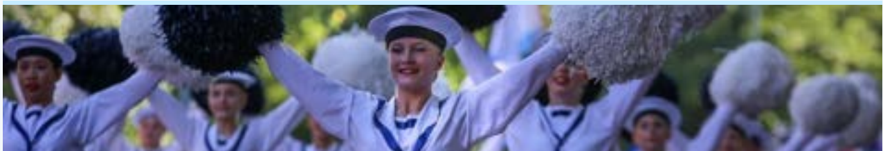
Kotkan Meripäivät

Tiedotus on olennainen osa promootiota. Tiedotuksessa palvellaan mediaa avoimuusperiaatteen mukaisesti. Tärkeitä välineitä ovat verkkosivut, Twitter-tili, vuosiesite ja sähköinen uutiskirje. Sähköistä uutiskirjettä lähetettiin 1-2 kertaa kuukaudessa noin 2300 tilaajalle, ja jokaiselle jäsenfestivaalille tarjottiin vähintään yksi mainospaikka vuodessa. Teknisenä alustana käytettiin MailChimp-palvelua.