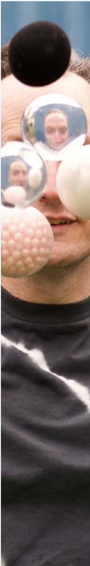
Rauma Festivo