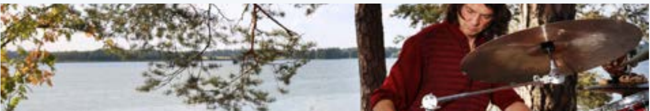
Meidän Festivaali

Jälleenrakennus ei tapahdu ilman investointeja. Tällä hetkellä yleishyödyllisten yhdistysten ylläpitämien taide- ja kulttuurifestivaalien tuki on noin 5 miljoonaa euroa vuodessa. Se on vain yksi euro/suomalainen. Festivaalien valtiontuki ei enää pitkään aikaan ole heijastanut alan todellista merkittävyyttä, siksi sektorin valtiontuki on aika nostaa vastaamaan alan todellisia tarpeita ja kulttuuripoliittista merkittävyyttä.